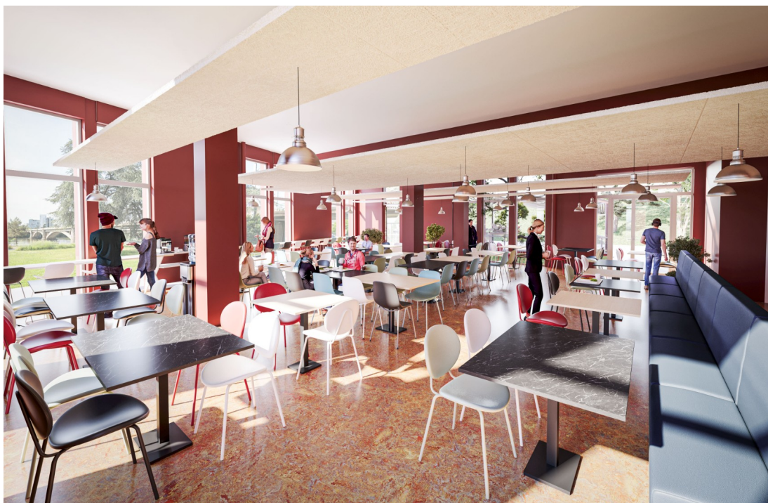
Salle de restauration de 100 places

Possibilité d'avoir des paniers repas en fonction des activités prévues au cours de la semaine.